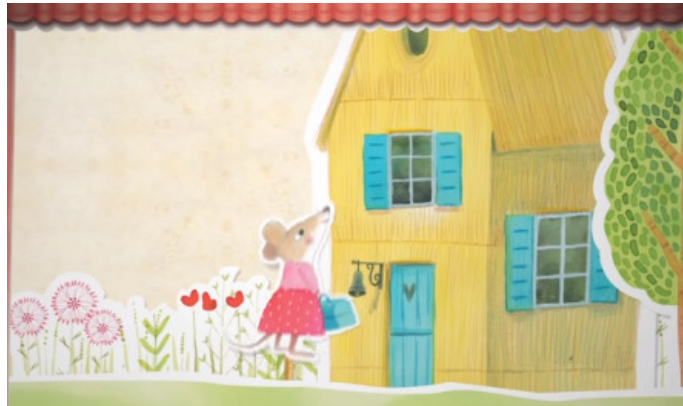
Cuento popular ruso

En la mitad del campo había una casita de paja, rodeada de prados y flores.