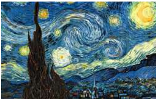
La noche estrellada

5. Señalar las diferencias que puedas apreciar en las siguientes obras: (Nombralas y enumeralas).