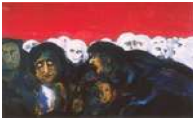
1) "El enjuiciamiento I", Augusto Barcia. (Expresionismo)