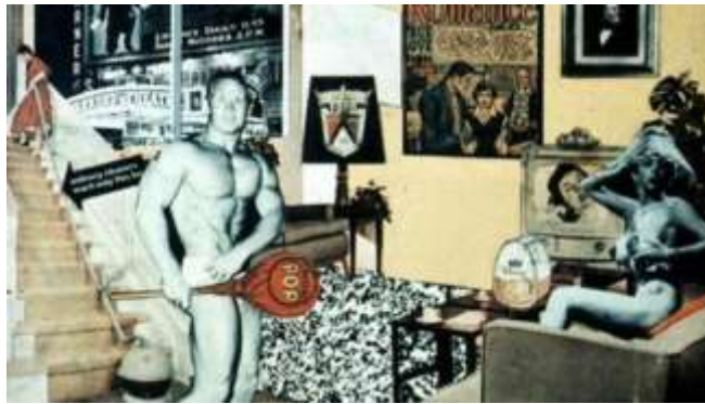
4) "Just what is it that makes today's homes so different, so appealing?", Richard Hamilton. (Pop Art)