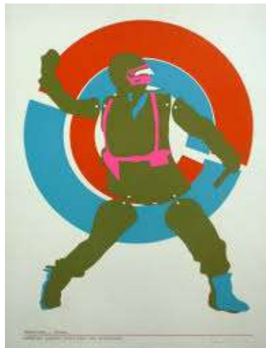
4) "Desármelo y bótelo peligroso juguete móvil para uso antipopular", Guillermo Nuñez. (Pop Art)