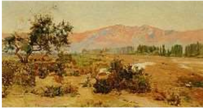
2) "Paisaje de Cordillera", Alberto Valenzuela Llanos. (Impresionismo)

Thesa La bella Gentil princesa Es una blanca estrella Es una estrella japonesa. Thesa es la más divina flor de Kioto Y cuando pasa triunfante en su palanquín Parece un tierno lirio, parece un pálido loto Arrancado una tarde de estío del imperial jardín. Todos la adoran como a una diosa, todos hasta el Mikado Pero ella cruza por entre todos indiferente De nadie se sabe que haya su amor logrado Y siempre está risueña, está sonriente. Es una Ofelia japonesa Que a las flores amante Loca y traviesa Triunfante Besa.