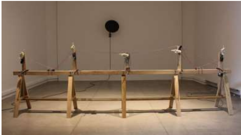
5) “Material insuficiente”, Pablo Rivera. (Minimalismo)