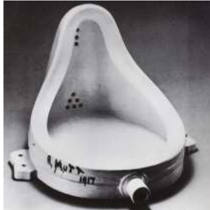
3) "El urinario", Marcel Duchamp. (Dadaísmo)