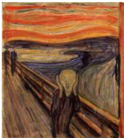
2) “El grito”, Edvard Munch. (Expresionismo)