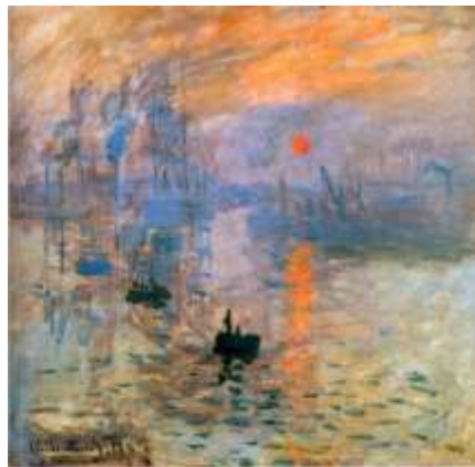
1) “Impresión, sol naciente”, Claude Monet. (Impresionismo)